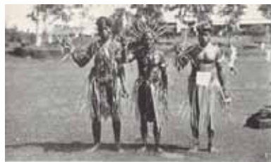
Life in Japan's southern provinces: ① Harvest in full bloom. ② Fishing. ③ Coconut Island. ④ Harvest time.