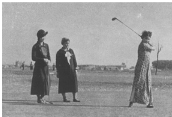
貴重な植民地各地写真の数々