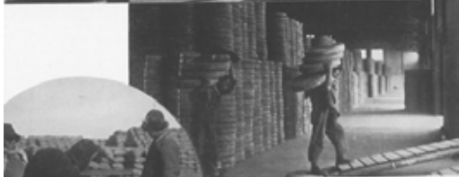
Industrial Manchukuo: ① Loading beans off for shipment. ② Bean casks. ③ Weighing beans. ④ Beans for distribution throughout the world.