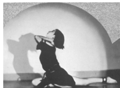
▲ 珍しい写真入りの企業広告も多数