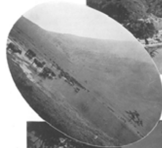
In Shinano prefecture: ● The Grand Shrine of Inari ● Part of Mt. Shinomori ● Shinobu ● The sunset on Lake Shinobu